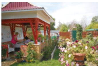
▲郊外の菜園付き住宅「ダーチャ」の生活を体験