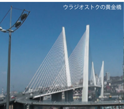
ウラジオストクの黄金橋