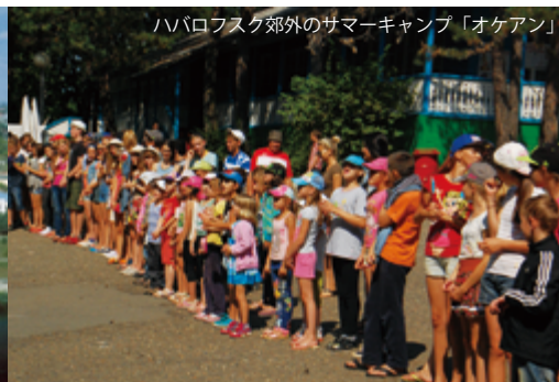
ハバロフスク郊外のサマーキャンプ「オケアン」