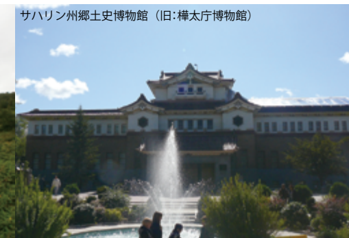
サハリン州郷土史博物館 (旧: 樺太庁博物館)