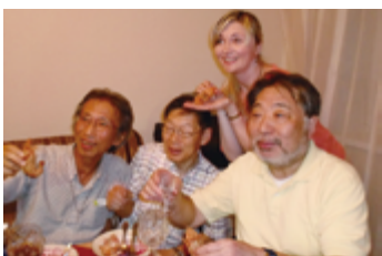
▲一般市民の暮らしを知りたい方におすすめ！