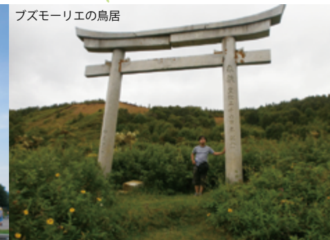
ブズモリーエの鳥居