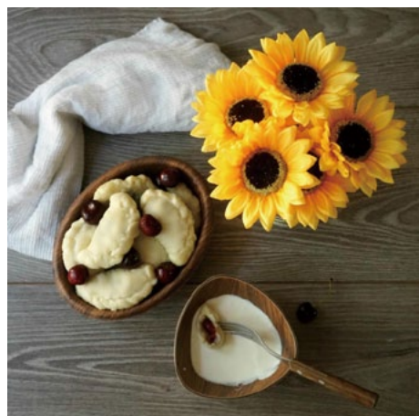
▲「ヴィイ」に登場するさくらんぼのヴァレーニキ