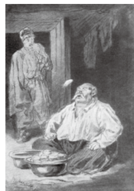
▲「ディカーニカ近郊夜話」より パツユークがヴァレーニキを 器から口に飛ばして食べる場面

ニコライ・ゴゴリの肖像 (F. A. モレル画、1840年、 トレチャコフ美術館所蔵)